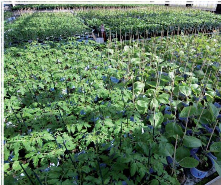
Roubovaná zelenina v substrátu pro balkonové rostliny – Florcenter Olomouc

rašelin s rašelinami frézovanými vzniká základ substrátu. Dolomiticými vápenci se upraví požadované pH substrátu, přidají se živiny a mik-