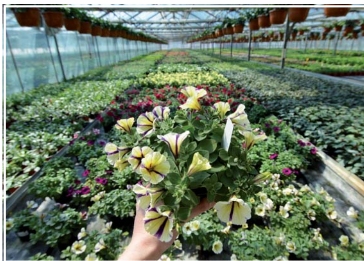
Nové odrůdy Potunii v substrátu pro Surfinie – Florcenter Olomouc

Nejdůležitější složkou většiny substrátů je kvalitní rašelina, která je těžena v Pobaltí. Jedná se jak o frézované rašeliny, tak i pravé borkované rašeliny. Kombinací borkovaných