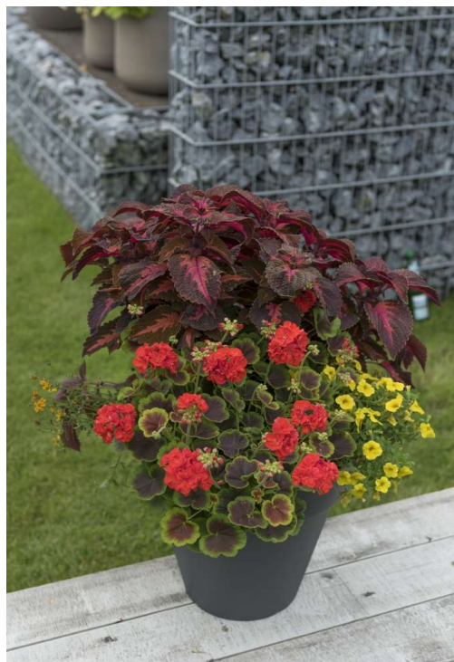
Garden Party Luminous Brocade