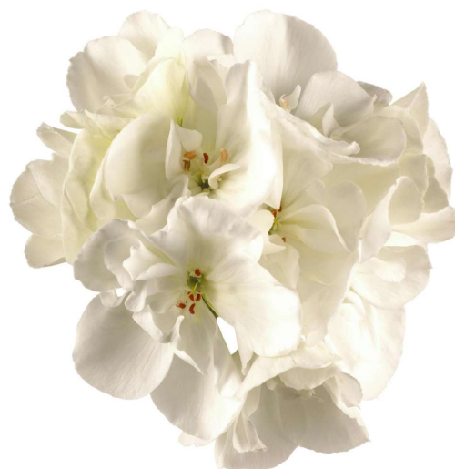
Survivor Idols White