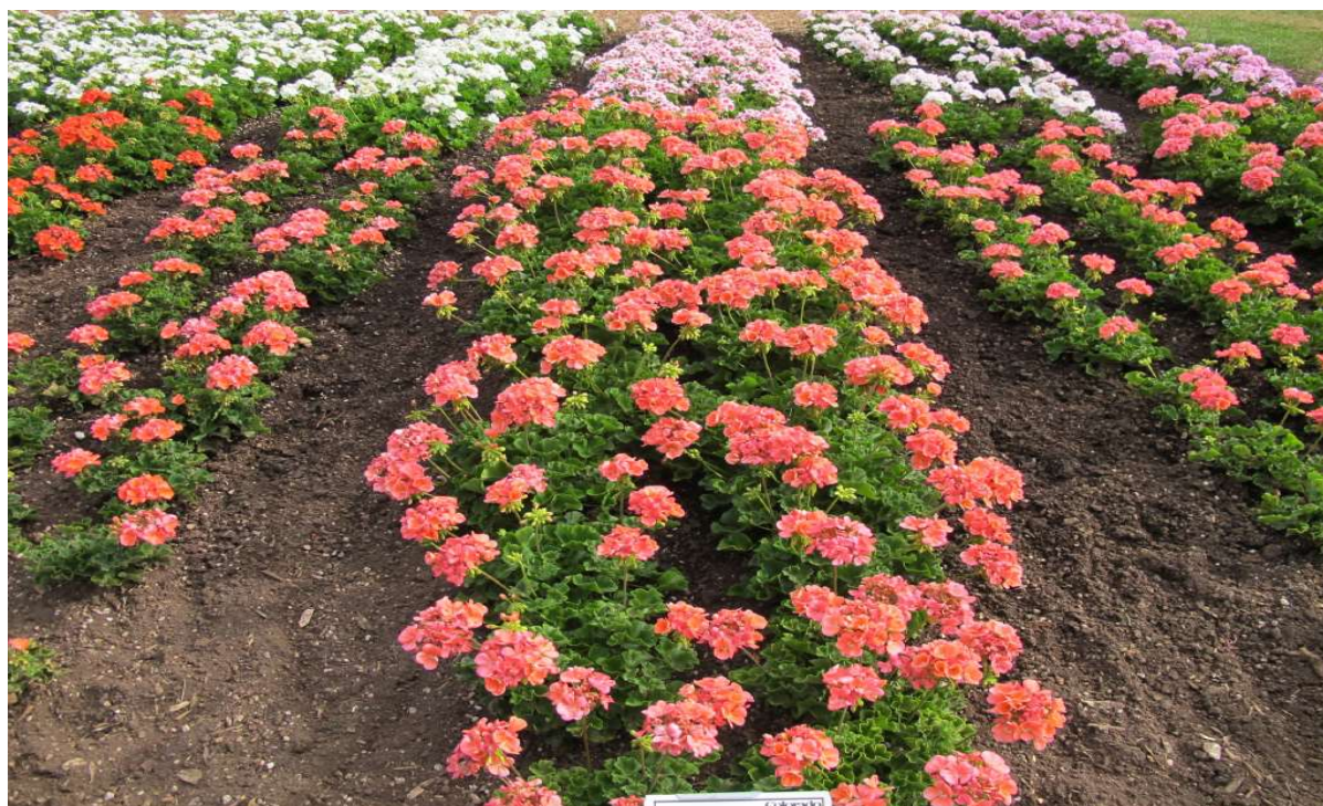
Survivor Idols Coral

Tento hybrid je částečně provázán s geny původem z Jižní Afriky