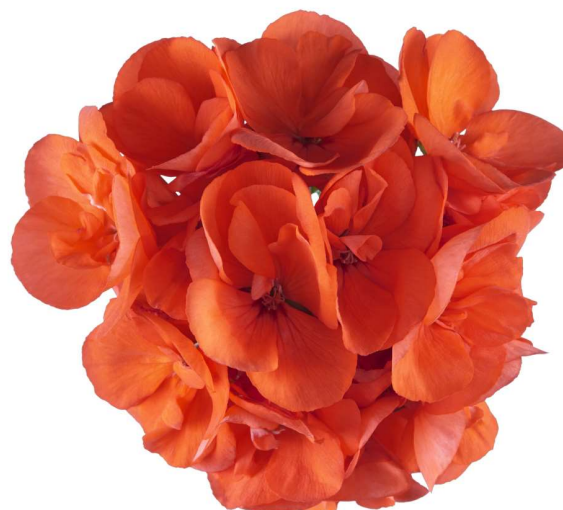
Survivor Idols Apricot

Apricot, Baby Face, Blue, Bright Red, Coral, Dark Red Indigo Sky, Indigo Sky 2019, Pink, Pink Batik, Pink, Mega Splash, Salmon Sensation, White, White 2017